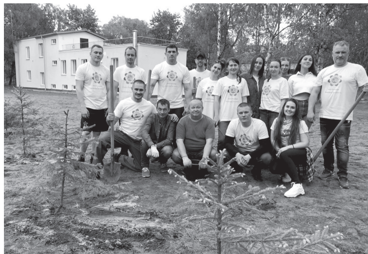
Активисты Союза высадили зелёную изгородь на территории детского хосписа

— Времена изменились — сегодня мы говорим уже не о выживании, а о развитии. Государство действительно заботится о дачниках и садоводах, оказывается серьезная помощь. Можно вспомнить выделение 1 миллиарда 300 миллионов рублей на ремонт дорог, прилегающих к садоводствам. Это то, чего люди действительно ждут.