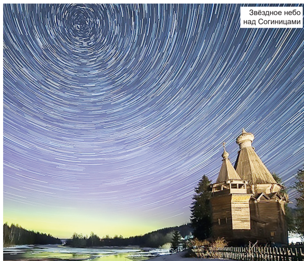
Звёздное небо над Согиницами

Воздух от мороза сух, Вечер на исходе. И снежинки, словно пух, Кружат в хороводе.