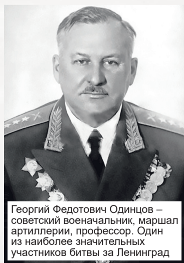
Георгий Федотович Одинцов – советский военачальник, маршал артиллерии, профессор. Один из наиболее значительных участников битвы за Ленинград

На Ораниенбаумский плацдарм было доставлено с Большой земли 53 тысячи человек личного