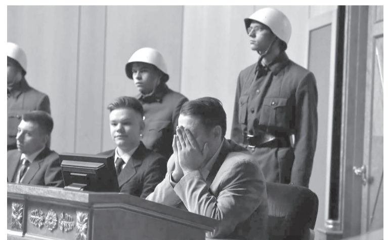
■ На скамье подсудимых оказались 24 обвиняемых

— Нюрнбергский процесс остаётся главным судом над нацистами, он касается и преступлений, совершённых на нашей земле. Три фронта — Ленинградский, Волховский, Карельский, более 1140 дней шли бои на территории нашей родной Ленинградской области, почти 900 дней