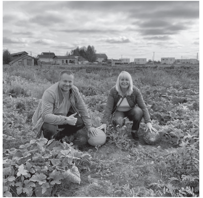
Новый глава организации и сам занимается садоводством

— Нам очень важно, чтобы все садоводства «от А до Я» вошли в наш союз. Представьте себе: если газификацию просит конкретное СНТ — это одно де-