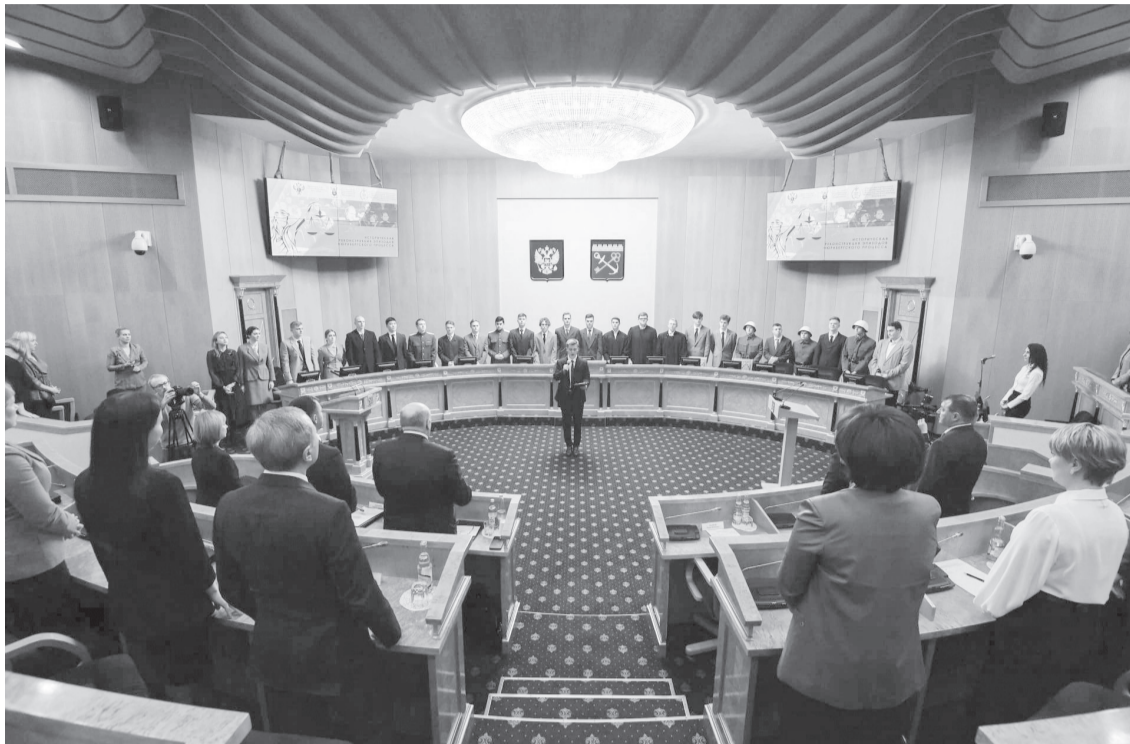
■ Будущие юристы посвятили документальную постановку всем жертвам нацизма