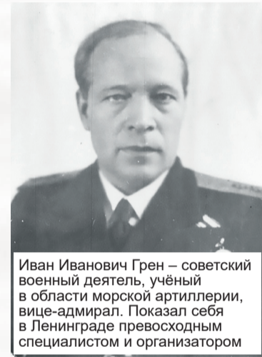
Иван Иванович Грен – советский военный деятель, учёный в области морской артиллерии, вице-адмирал. Показал себя в Ленинграде превосходным специалистом и организатором

Всего в операции «Январский гром» участвовало 205 орудий только крупного и среднего ка-