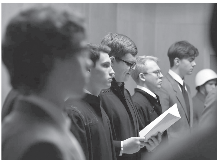
■ Судебный процесс в Нюрнберге длился на протяжении 10 месяцев