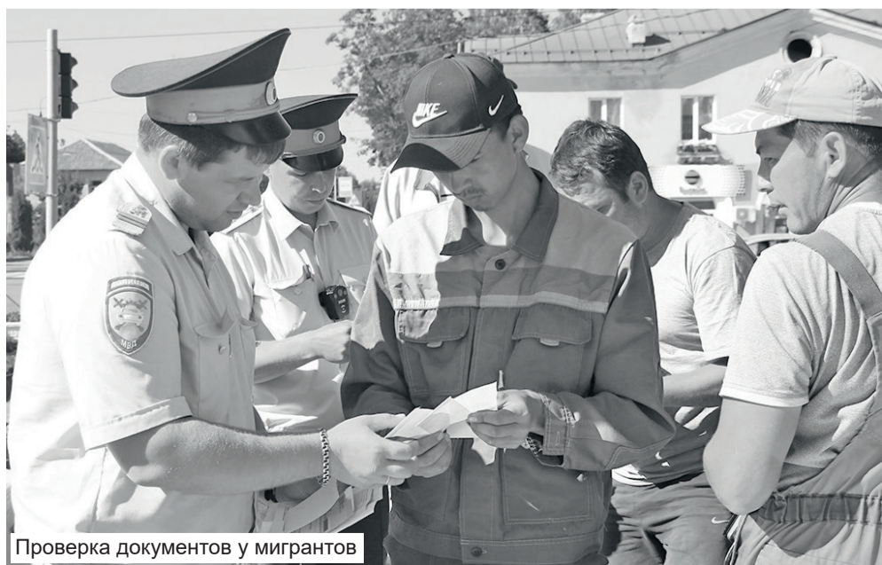
Проверка документов у мигрантов

Константин КАШИН