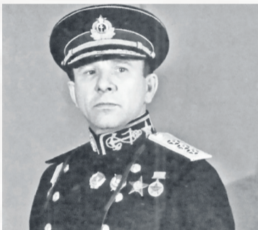
Владимир Филиппович Трибуц – советский военачальник, командующий Балтийским флотом, адмирал, доктор исторических наук. Участвовал в разработке и проведении операций по прорыву блокады и разгрому противника в районе Ленинграда, а также в Выборгской, Свирско-Петрозаводской наступательных операциях